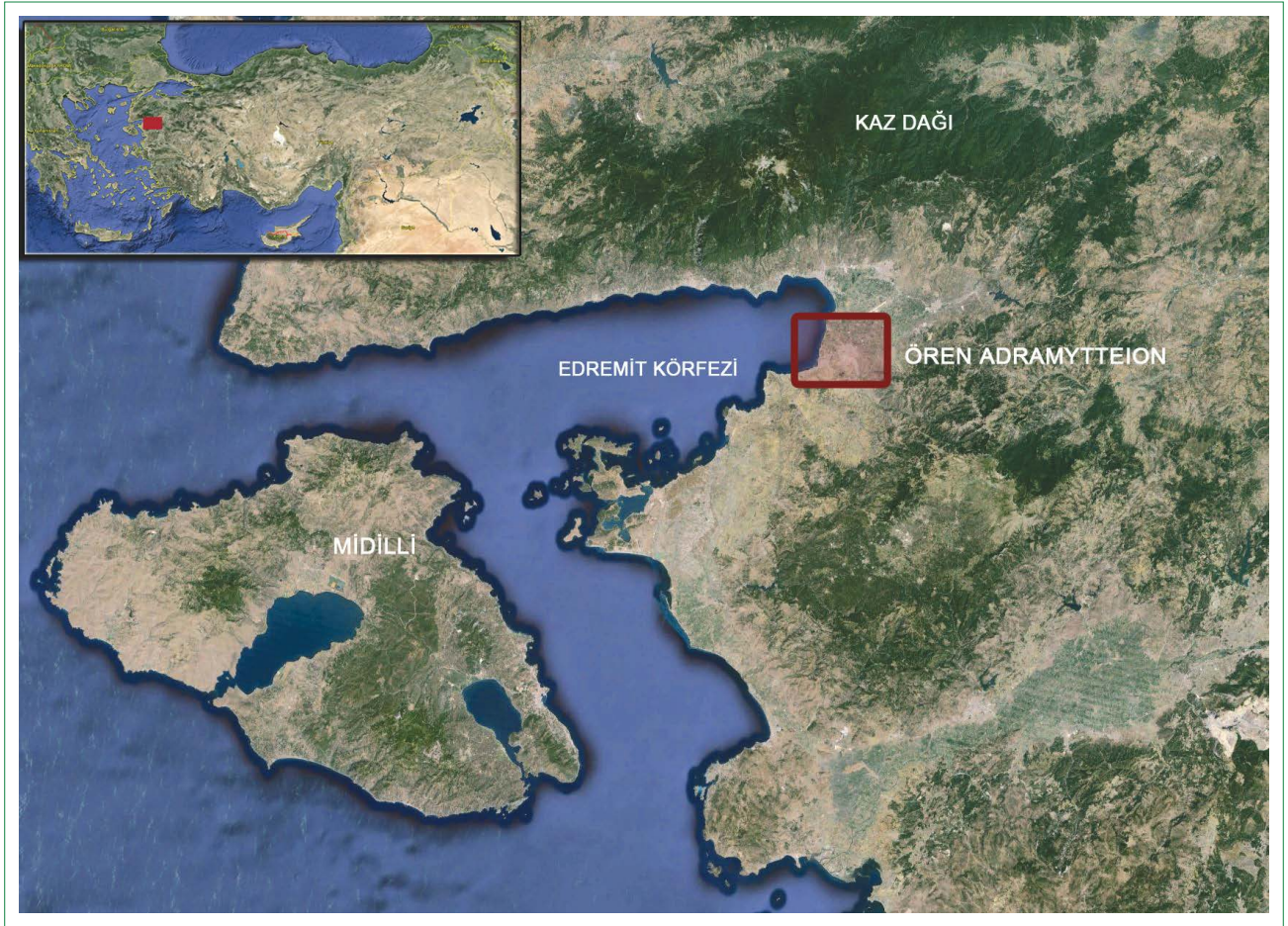
Şekil 1. Ören/Adramytteion Antik Kenti'nin konumu.

şehrinin bir mahallesidir (Şekil 1). Ören günümüzde çoğunlukla yazlıklardan oluşan bir sayfiye karakterine sahiptir.