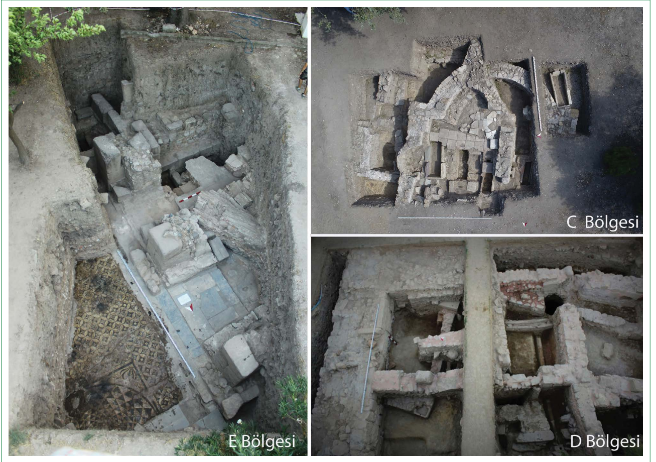
Şekil 3. Ören/Adramytteion Antik Kenti C, D ve E bölgesi kazı alanı.

çoğunlukla bahçeli sayfiye evlerinden oluşan düşük yoğunluklu bir yazlık yerleşme ortaya çıkmıştır. Bugünkü Ören yerleşmesi 1954–1960 yılları arasında Burhaniye’de kaymakamlık yapan Hüseyin Öğütçen öncülüğünde 1955–1960 arasında Burhaniye Belediye Başkanlığı yapmış olan Avni Meço işbirliği ile ortaya çıkmış ve biçimlenmiştir (2. Yazar, 2013a).