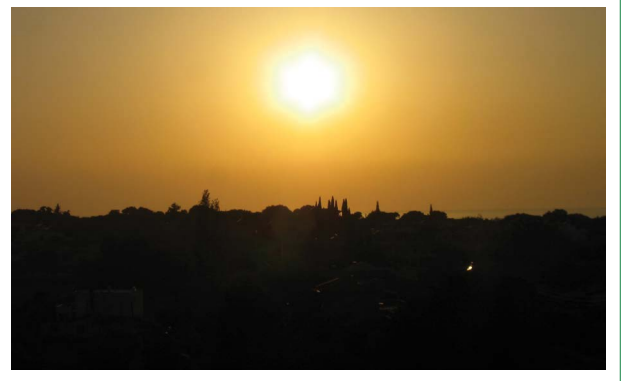
Şekil 10. Ören/Adramytteion Antik Kenti Arkeolojik Sit Alanı'nı silüeti (2. Yazar, 2012).

Şüphesiz bunlara Ören'in özgün ve yeşil dokuyla bütünleşmiş servilerin vurguladığı silüeti de eklenmelidir (Şekil 9, 10). Dolayısıyla, Ören'de korunması gerekli miras öğeleri çok katmanlı ve çeşitli bir yapı sergilemektedir. Ören'de plan kapsamında değerlendirilen ve mevcut hali ile korunması gereken miras öğeleri şu şekilde tanımlanmıştır: