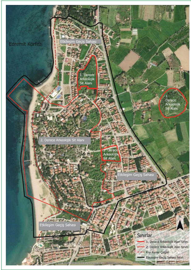
Şekil 4. Ören/Adramytteion Antik Kenti 1. ve 2. Derece Arkeolojik Sit Alanı ve etkileşim geçiş sahası sınırları.

Ayrıca 1960'ların başlarında da Ören sakinleri tarafından bu eserlerin toplanarak yörede bir müze talebinde bulunduğu ve dönemin mülki amirlerinin de yörede bulunan arkeolojik eserlerin sergileneceği bir müze kurulması konusunda vaatle buldukları döneme ait gazete haberlerinden izlenebilmektedir. 3 1973 tarihli 1710 sayılı Eski Eserler Kanunu'nun kabul edilmesinden iki yıl sonra 1975 yılında Ören Adramytteion antik kenti sit alanı olarak tescillenmiştir. Bu karar kapsamında Ören'de oluşturulan Tarihsel Sit Alanı bugünkü Arkeolojik Sit Alanı'ndan daha geniş şekilde, kabaca Ören Adramytteion Arkeolojik Sit Alanı Koruma Amaçlı İmar Planı onama sınırlarına yakın bir alanı kapsamaktadır. 1983 yılında 2863 sayılı Kültür ve Tabiat Varlıklarını Koruma Kanunu'nun yürürlüğe girmesini izleyen yıllarda sit alanının tekrar gündeme geldiği ve sit sınırlarının değiştirildiği görülmektedir. Adramytteion yerleşme alanı Bursa Kültür ve Tabiat Varlıkları Koruma Kurulu'nun