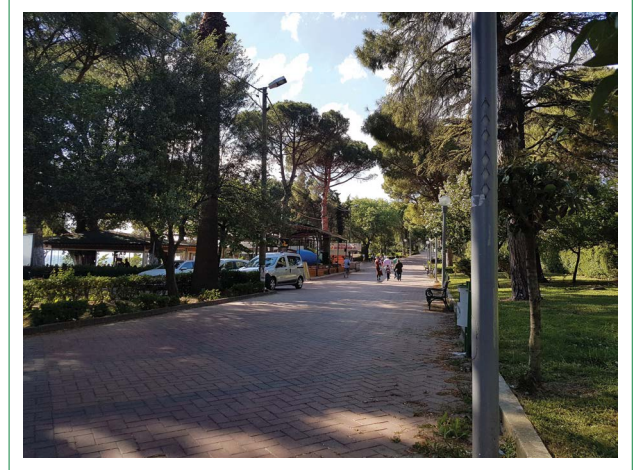
Şekil 7. Ören/Adramytteion Antik Kenti Arkeolojik Sit Alanı, meşe ağaçları ve yeşil doku bütünlüğü (2. Yazar, 2017).

Arkeolojik mirasın korunması, değerlendirilmesi ve arkeolojik bilimsel araştırma faaliyetlerinin sürdürülmesi öncelikli temel koruma değeridir. Aynı zamanda mevcut yerleşme düzenlerinin de kültürel mirasın bir parçası olarak korunması gerekmektedir. Her ne kadar yapılaşma sürecinde Adramytteion antik kentine ait arkeolojik izlere zarar vermiş olsa da Ören’de 1960’larda oluşmuş sayfiye karakterli ve nitelikli yapı çevre, sahip olduğu döneminin Türkiye’deki mimarlık ve şehircilik anlayışını yansıtan ve günümüzde örnekleri azalmış olan yapı ve yerleşme dokusu ile korunması gerekli bir kültürel miras olarak değerlendirilmeyi hak etmektedir. Bunlara ek olarak, mevcut yerleşme ve yakın çevresindeki yeşil örtü de koruma kapsamında değerlendirilmiştir. Yöreye özgü ve 1003 adedi tescilli toplam 1443 Palamut Meşesi yanı sıra, başta Servi, Çam, Zakkum ve Akasya olmak üzere çeşitli ağaçlardan oluşan yoğun bitki örtüsü ve bakımlı bahçeler de korunması gerekli varlıklar olarak kabul edilmişlerdir (Şekil 7).