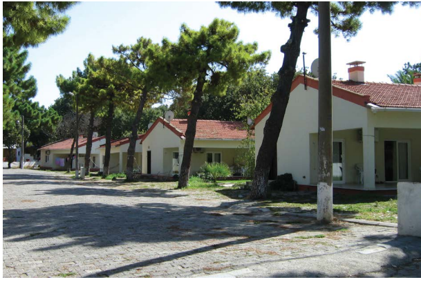
Şekil 6. Ören/Adramytteion Antik Kenti 2. Derece Arkeolojik Sit Alanı'nda bulunan 20. yüzyıl yapıları (2. Yazar, 2012, 2013).

taşınır varlıklar, diğer tür anıtlar ve bunların çevresi, ister toprakta ister su altında bulunsunlar, arkeolojik mirasa dahildirler.” (TBMM, 1999).