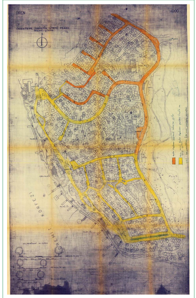
Şekil 12. 1957 yılında Abdullah Ardali ve Nihat Güner tarafından yapılan Ören Vaziyet Planı.

sit alanı koruma amaçlı imar planı hedeflerindedir. Bu hedef doğrultusunda antik kentin ve arkeolojik kazıların yöreye kazandırdığı tarihsel ve arkeolojik kimliğe uygun ve uyumlu olarak Ören'e arkeoloji temelli ve temalı bir kamusal yeşil alan kazandırma fikri yani arkeolojik park önerisi uygun görülmüştür. Arkeopark, tarihsel değerler ve kent kullanıcılarının rekreasyonel faaliyetlerini karşılama unsurlarını taşıyan kültürel ve arkeolojik miras yönetimi ile kentsel rekreasyonel faaliyetlerin birlikte sunulduğu kent içinde yeni bir yorumlama merkezidir (Tuna ve Erdoğan, 2016). Ören /Adramytteion Arkeolojik Parkı, kazı alanlarını ve Ören kıyı aksını içerir (Şekil 11). Halihazırda Ören'de kıyı aksı boyunca uzanan yaya alanı hemen hemen tümüyle gezinti ve yeme-içme ihtiyaçlarına hitap etmektedir. Bu yanlış olmasa da arkeolojik açıdan böylesine kıymetli bir alan ve değerli konum için önemli eksiklikler içeren bir kullanımdır. Bu sebeple kıyı aksının koruma planında arkeopark alanı olarak kentsel tasarım projeleriyle düzenlenmesi öngörülmüştür.