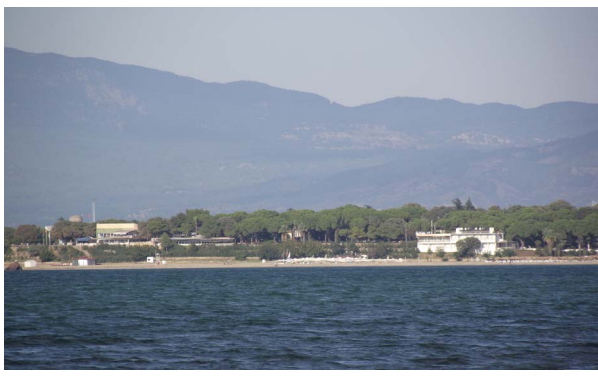
Şekil 9. Ören/Adramytteion Antik Kenti Arkeolojik Sit Alanı'nın denizden görünümü (2. Yazar, 2013).