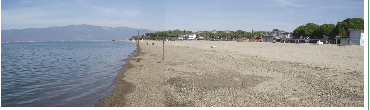
Şekil 8. Ören Kumsalı, güney yönünden bakış (2. Yazar, 2013).