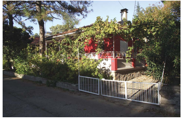
Şekil 7. Ören/Adramytteion Antik Kenti Arkeolojik Sit Alanı, meşe ağaçları ve yeşil doku bütünlüğü (2. Yazar, 2017).

İlk olarak korumanın kapsamı tespit edilmiş, planlama alanında korunması gerekli kültür ve tabiat varlıklarının ayrıntılı bir envanteri oluşturulmuştur. Sit alanı, arkeolojik mirasın korunması önceliğinde yer altı ve yerüstünde çok katmanlı bir kültürel yapı sergilemekte, aynı zamanda Ören halkıyla yaşayan, canlı bir yerleşme içermektedir. Yapılan gözlem ve tespitler sonucunda Ören’de korunması gerekli eserler ve çevrenin sadece arkeolojik mirasla sınırlı olmadığı anlaşılmıştır. Yeraltında, mevcut arkeolojik kazı bulguları ışığında en üstte Bizans döneminden başlayarak, Roma, Yunan, Arkaik dönem, Bronz çağı ve yer yer Kalkolitik döneme uzanan arkeolojik buluntulara oldukça düzenli bir stratigrafi halinde rastlanılmıştır (Özgen, 2013a) (Şekil 5). Mevcut yerleşme yapısı da 20. yüzyıla ilişkin özgün ve nitelikli bir yapılaşma örneği oluşturmaktadır. Antik kent üzerinde yer alan Ören yerleşim alanı ve yapı varlığının bir kısmı 1950’ler ve 1960’lı yıllarda inşa edilmiş afet konutları (Seylap Evleri), kooperatif evleri ya da münferit çeşitli yapılar gibi dönemlerinin yapı ve tasarım özelliklerini yansıtan diğer bir ifadeyle dönemlerinin nitelikli ve “karakterli” yapılarıdır (Şekil 6).