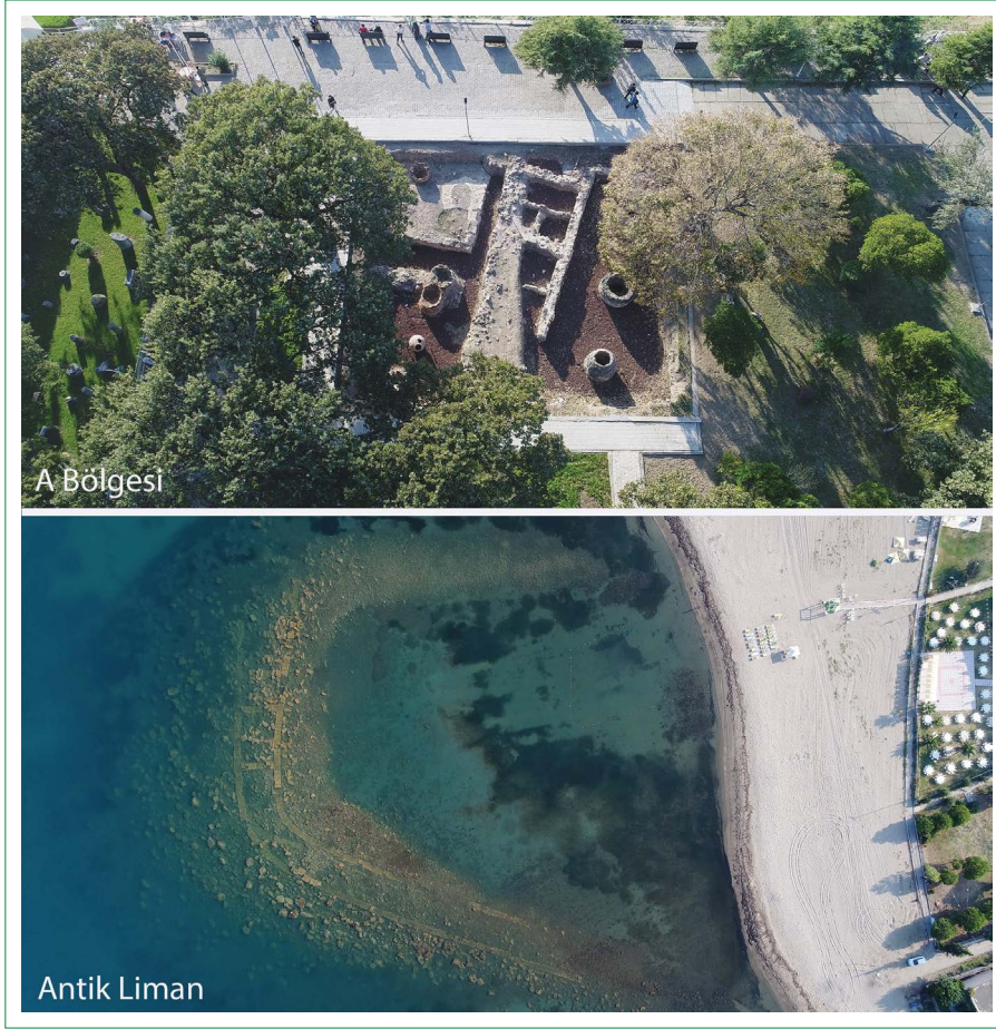
Şekil 2. Ören/Adramytteion Antik Kenti A bölgesi kazı alanı ve antik liman B bölgesi.

kısmen açığa çıkarılmıştır (Özgen, 2014). Alanda üst kotlarda Erken Bizans Dönemi malzemenin yoğunluk kazanması kronolojik olarak alanın kullanımında D bölgesi ile benzerlikler olduğunu göstermektedir. (Özgen, 2014). “E Yapısı” M.S. 2. ya da 3. Yy Roma Dönemi’nde olasılıkla hamam olan nitelikli bir kamu yapısına dair somut veriler sunmaktadır (Özgen, 2018).