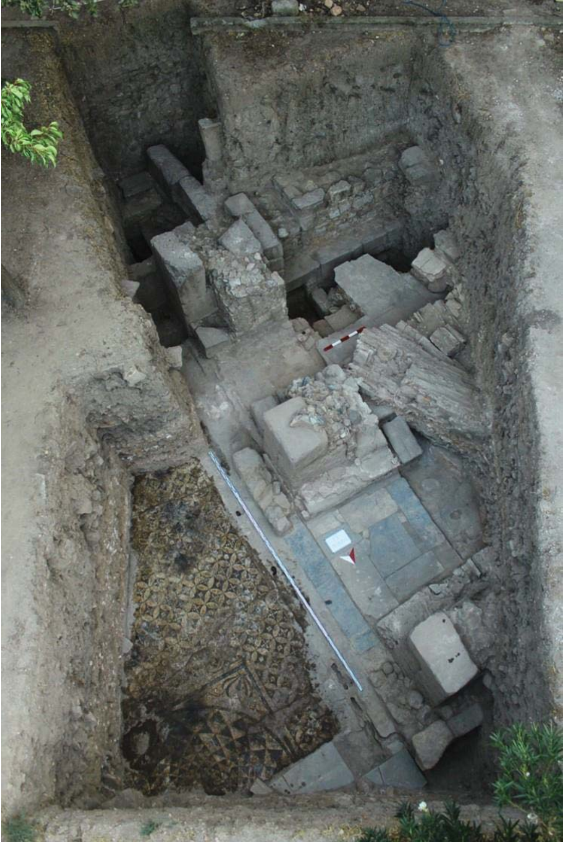
Levha 5, E Yapısı hava fotoğrafi