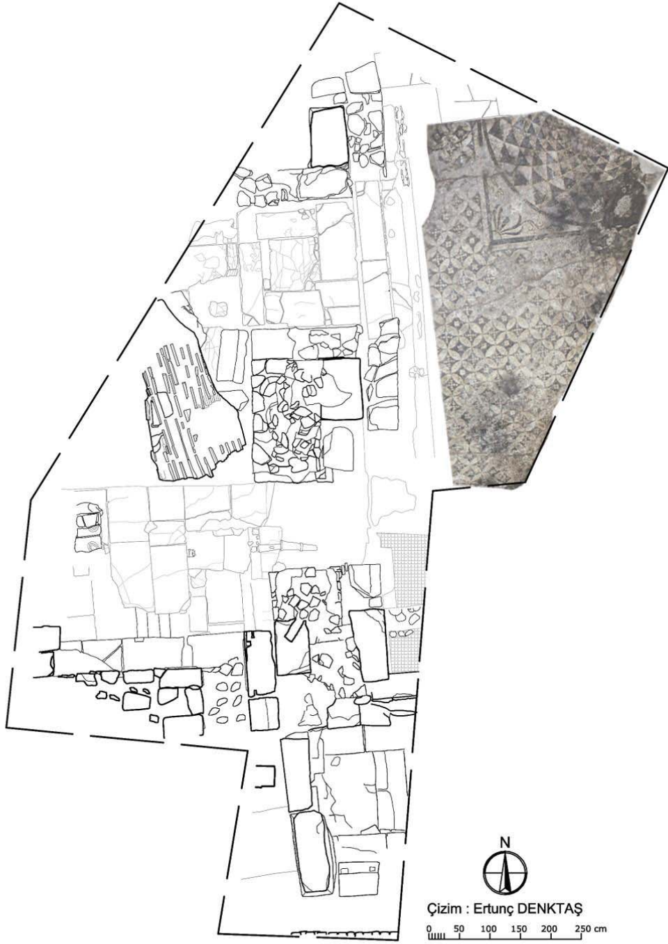
Levha 6, E Yapısı rölövesi