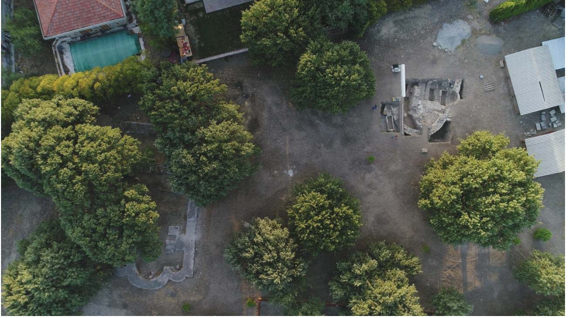
Levha 7 , C Bölgesi Güney (sol) ve Kuzey (sağ) kiliseleri, hava fotoğrafı