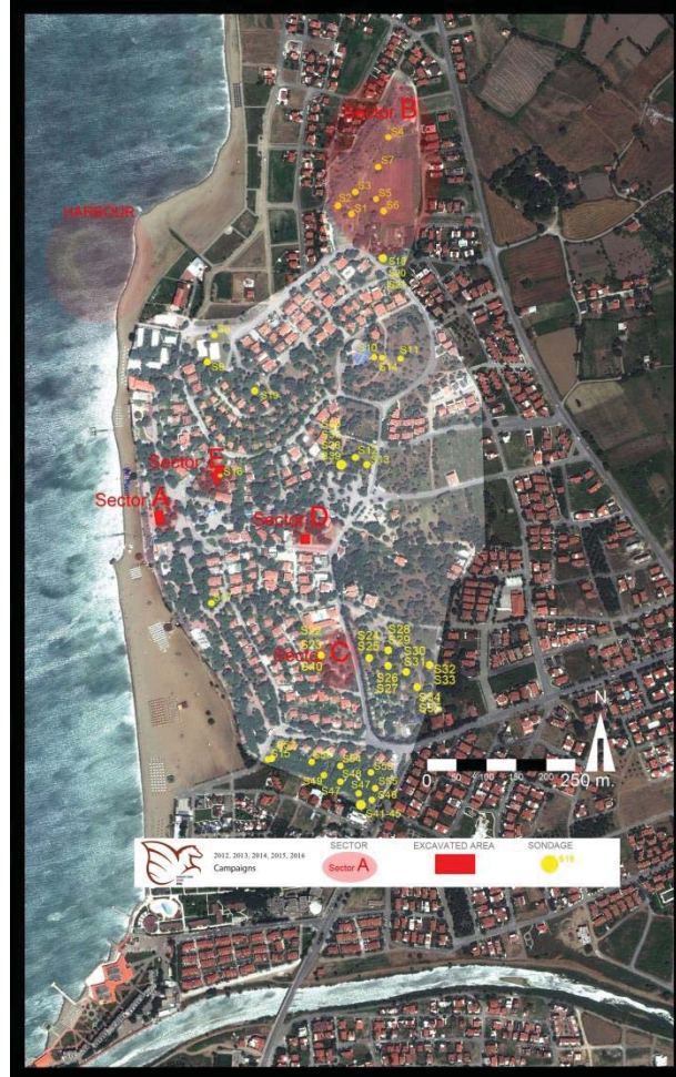
Levha 2, Adramytteion kazı ve onarım çalışma alanlarını gösterir uydu fotoğrafı