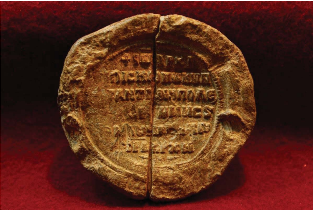
Levha 4, E Yapısı kurşun mühür buluntusu – arka yüz