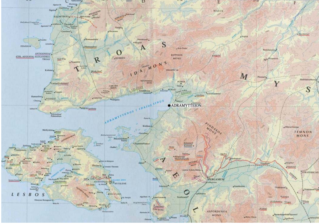
Levha 1, Adramytteion ve çevre alanı haritası (Barrington Atlas)