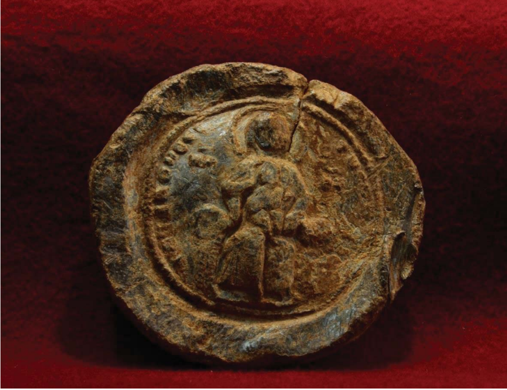
Levha 3, E Yapısı Kurşun Mühür Buluntusu – ön yüz