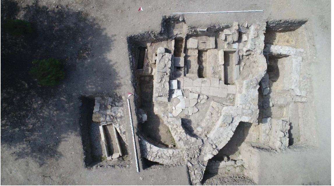
Levha 8 , C Bölgesi Güney Kilise, hava fotoğrafı