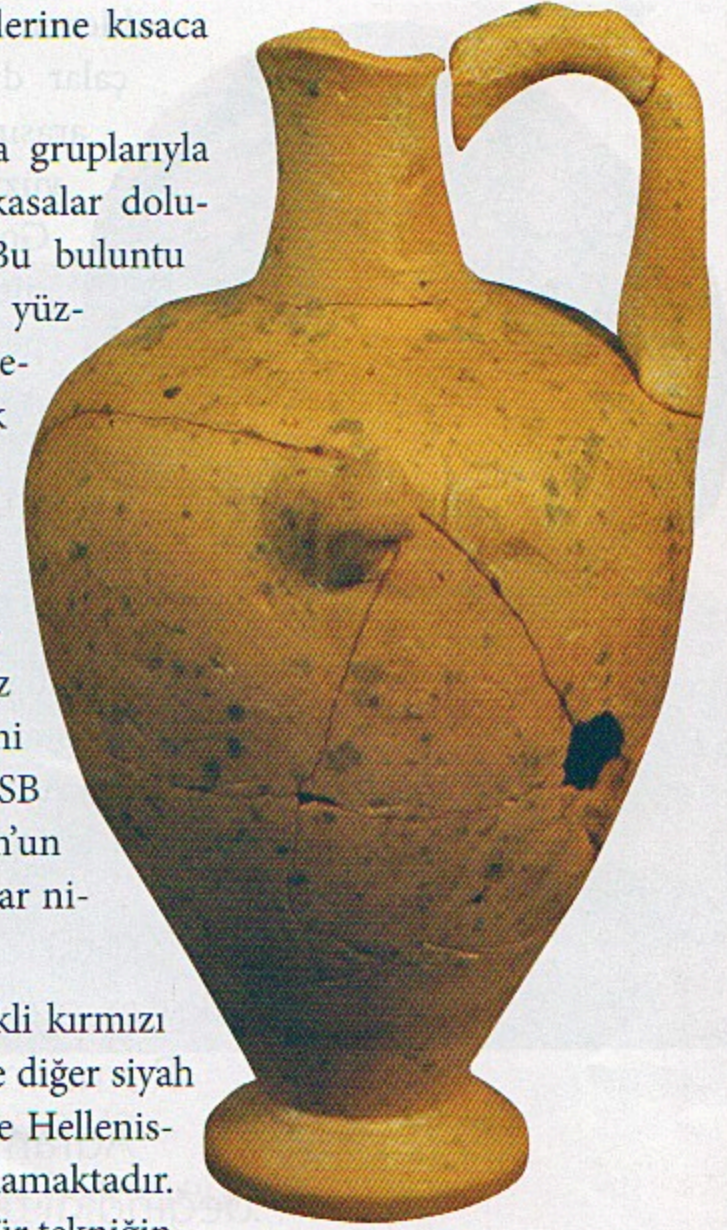
Minyatür hydria, MÖ 3. yüzyılın ilk çeyreği

Oldukça fazla sayıda parçalar halinde ele geçen polychrome geometrik desenlerin ve hayvan figürlerinin resmedildiği MÖ 7. yüzyılın Proto-Korinth vazolarına ait parçalar da Bergaz Tepe buluntularındandır. Yine MÖ 7. yüzyılın sonuna