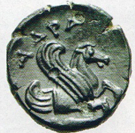
Arka yüz: ADRA lejantı ve kanatlı at, MÖ erken 4. yüzyıl