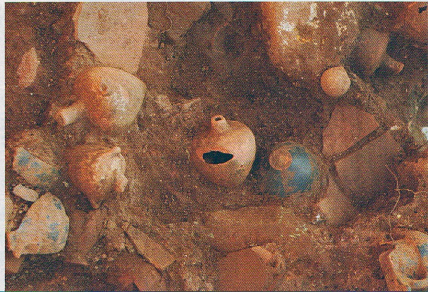
Toplu buluntu grubu, MÖ erken 3. yüzyıl