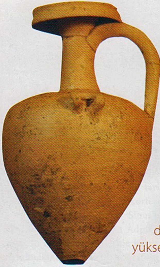
Minyatür hydria, MÖ 3. yüzyılın ilk çeyreği

Antik Mysia Bölgesi'nin önemli antik yerleşimlerinden biri olan Adramytteion, en yüksek yeri 20 metreye yaklaşan ve kendi üzerinde en kuzeydeki Bergaz Tepe olmak üzere dört tepelik barındıran bir yükselti üzerinde konumlanan bir liman yerleşimidir.