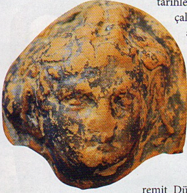
Pişmiş toprak Eros başı, MÖ 4. yüzyıl sonları

tarihlenen İonia Kuşlu Kaselerine ait parçalar diğer keramik buluntu grupları arasındadır. Bunların yanında, aynı yüzyılın ortalarına tarihlenen Wild Goath üslubunda farklı formlara ait parçalar da Bergaz Tepede ele geçmiştir.