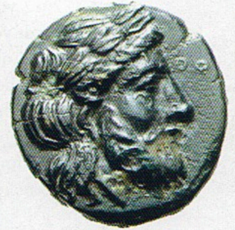
Adramytteionsikkesi, Ön yüz: Zeus başı

Ele geçen sikkelerin çoğunluğunu, farklı darp merkezlerinin Geç Roma ve Bizans Dönemi sikkeleri oluşturmaktadır. Anonim follisler ve çukur sikkeler de buluntular arasındadır.